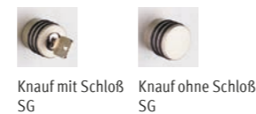
Knauf mit Schloß SG