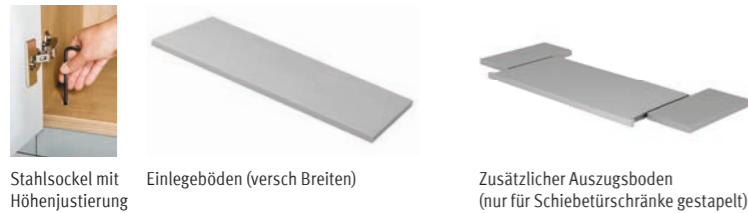
Stahlsockel mit Höhenjustierung